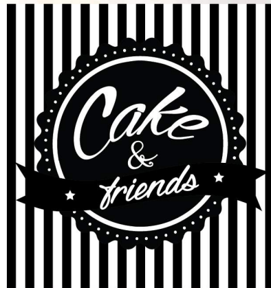
Versão Monocromática Positiva