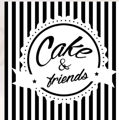
Versão Monocromática Negativo